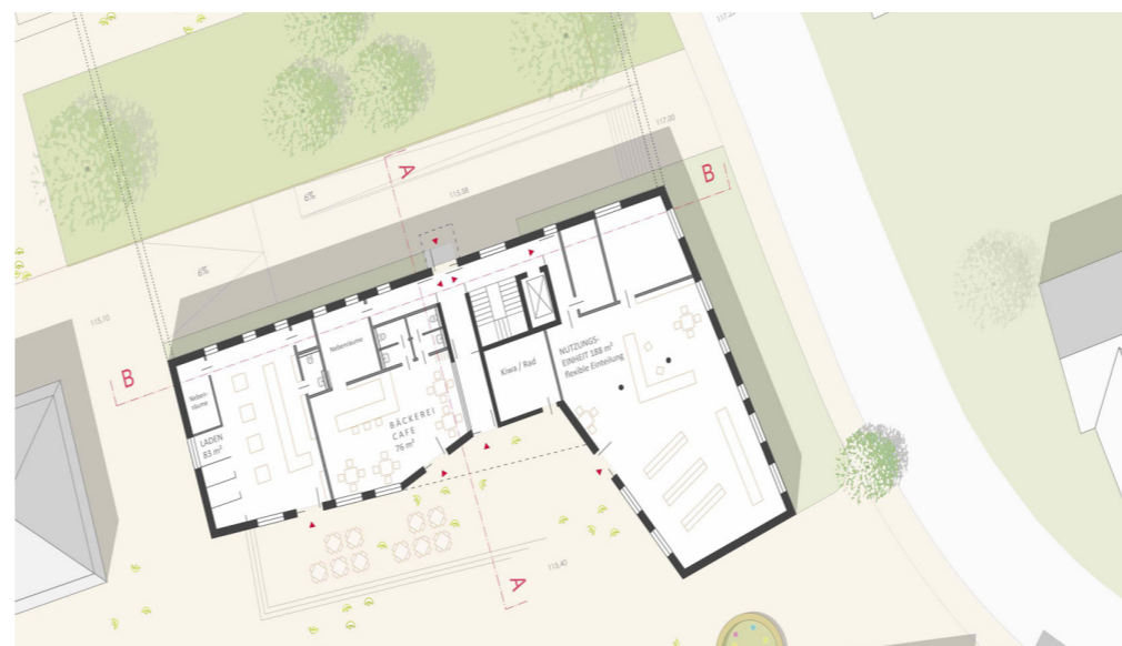
Lageplan / Erdgeschoss 1: 200