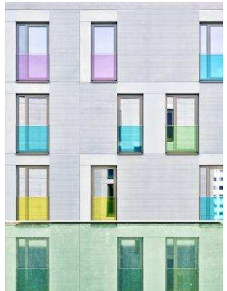
Klick zur Vergrößerung