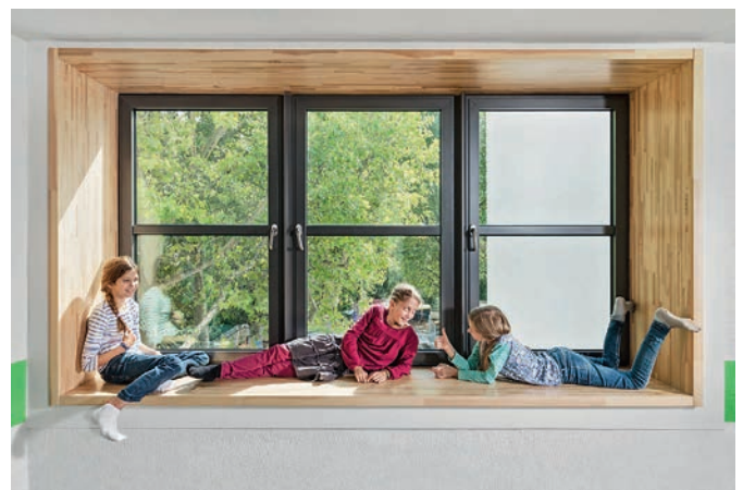
Bild 7. Die 3-fach verglasten Fenster