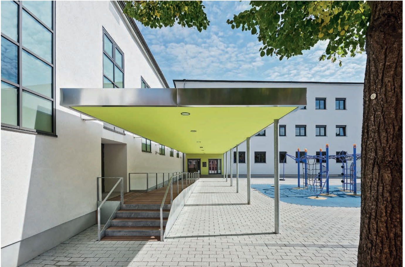
Bild 1. Überdachter Pausenbereich mit Zugang zur Sporthalle