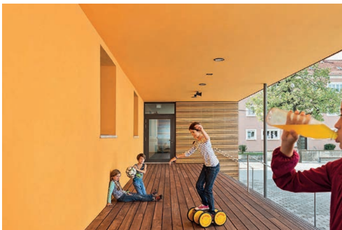
Bild 5. Die Pausenterasse des Anbaus