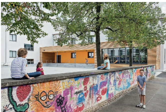
Bild 4. Der Anbau als Holzbaukörper mit Hauptzugang und Speisesaal