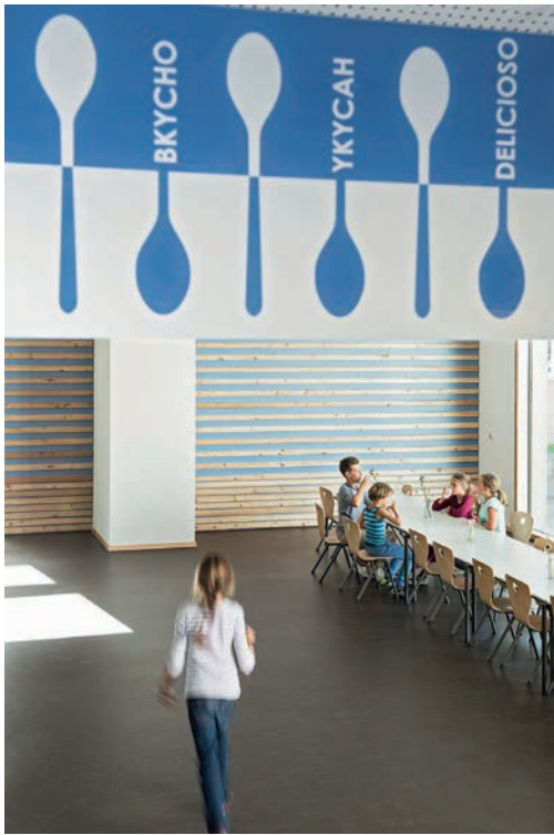
Bild 3. Innenansicht des Speisesaals der Raitelsbergschule