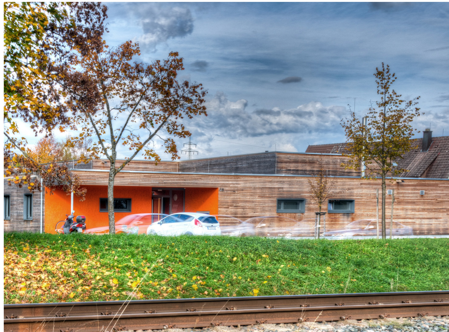
Blick von Osten/Hauptzugang

Beheizt wird das Gebäude ausschließlich über eine Holzschichtanlage mit großem Speichertank.