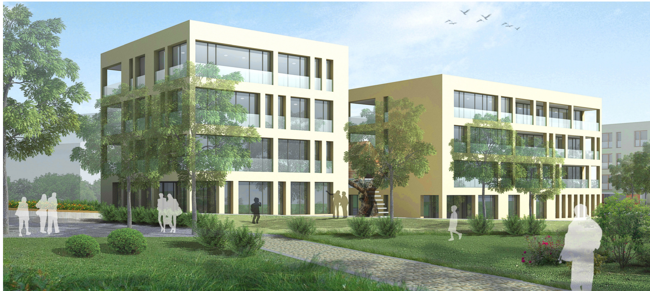
Blick vom Killesbergpark auf die Ostfassade

Die Architektur der beiden Wohngebäude legt Wert auf Klarheit und Zeitlosigkeit des Erscheinungsbildes, sie soll gegenüber der umgebenden Natur unaufdringlich sein. Die Flexibilität der Grundrisse sichert eine lange Nutzungsdauer der Gebäude, auch nach einer möglichen Änderung der Anforderungen.