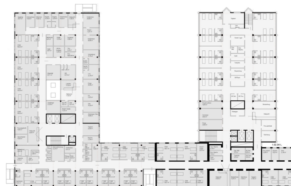
Grundriss des Erdgeschosses