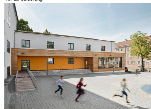
... und nach der Sanierung