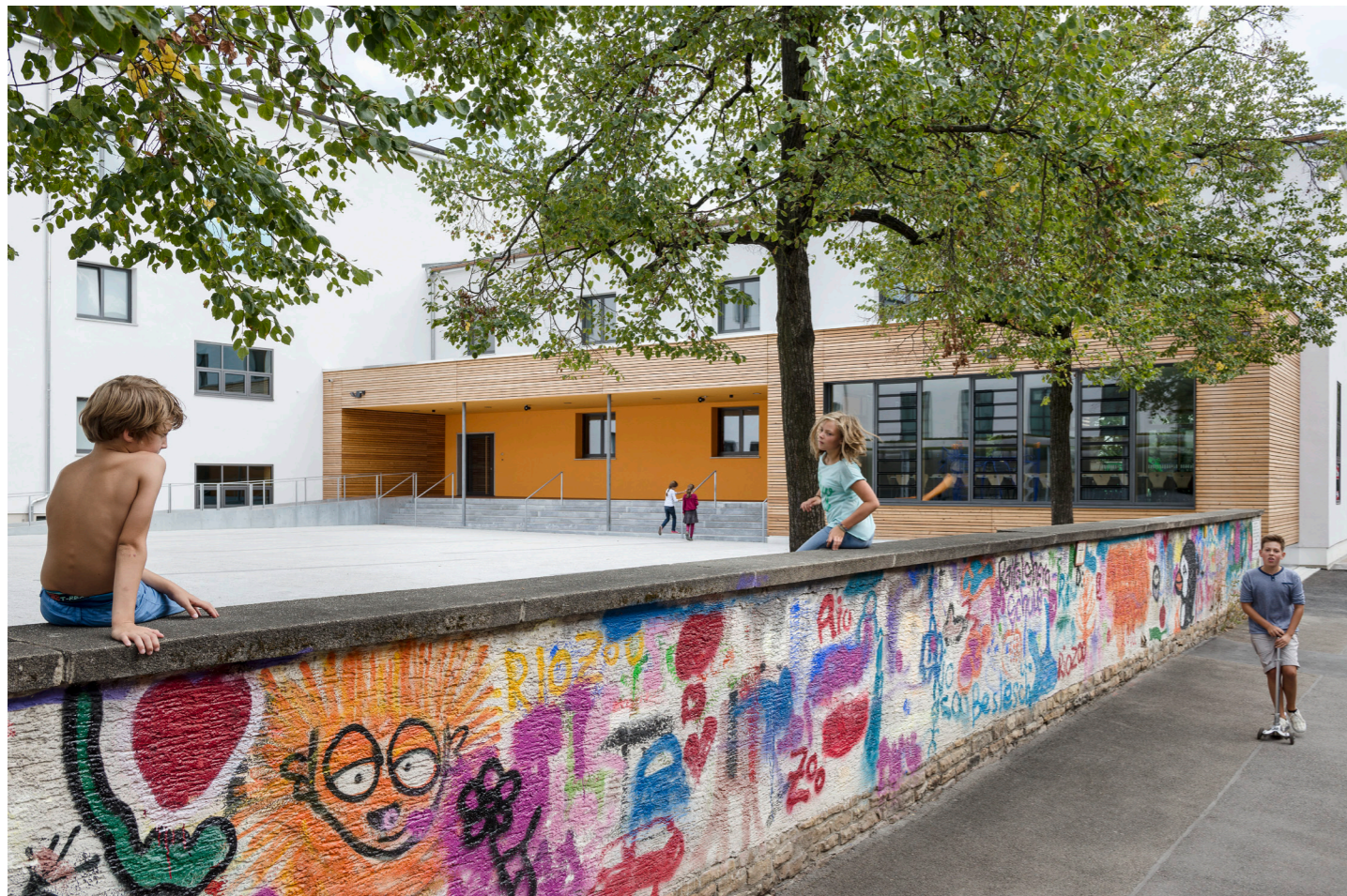
Die neue Zugangssituation mit dem holzverkleideten Anbau