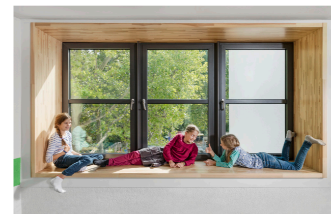
Ein großes Fenster mit Spiel- und Aufenthaltsqualitäten