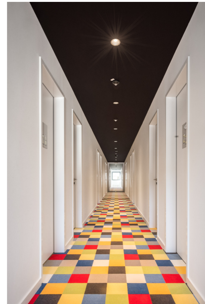
Das Thema der bunten Fassade findet sich auch im Innenbereich