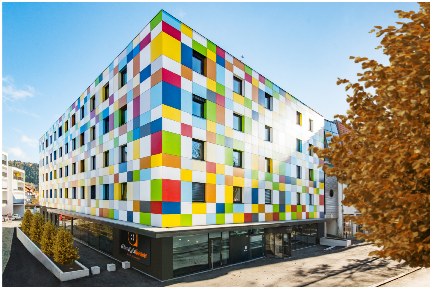
Blick auf die Hauptfassade