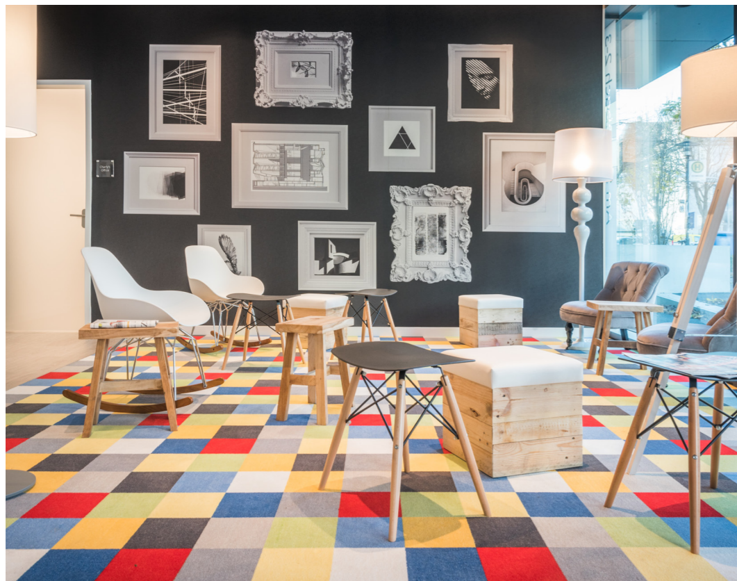
Der Lounge-Bereich im Erdgeschoss