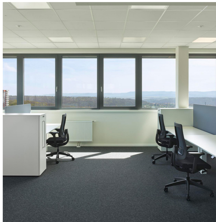
Blick aus einem Büro