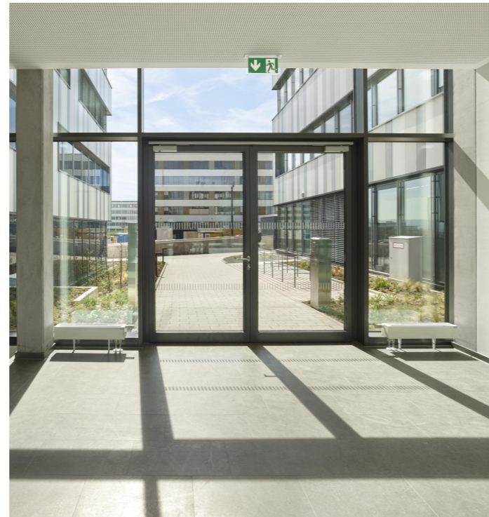
Blick in den Innenhof