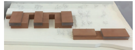
3. Preis Schätzler Architekten, München