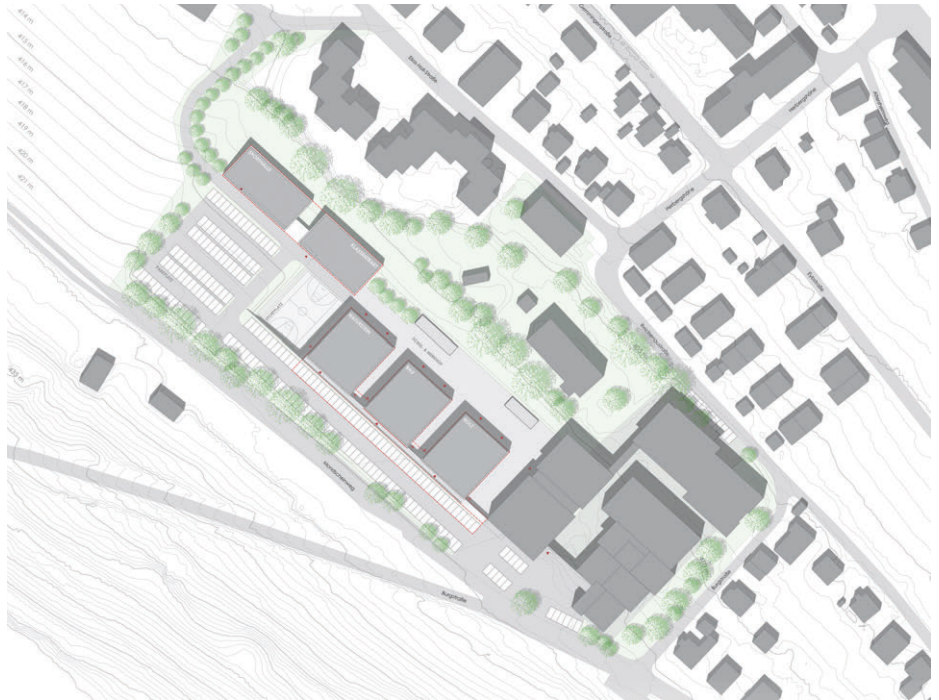
1. Preis Bodamer & Faber Architekten, Stuttgart

3. Preis Schätzler Architekten, München Walter Schätzler