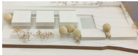
2. Preis W&V Architekten, Leipzig mit Landschaftsarchitekten Timo